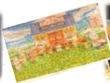
生徒会企画Ⅰ ミッションとじゃんけん列車で交流