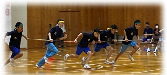
聖南バトル(運動会)